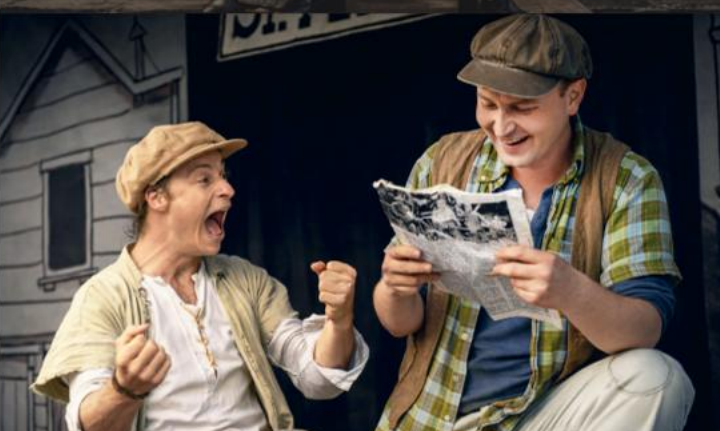
Tom Sawyer und Huckleberry Finn nach Mark Twain