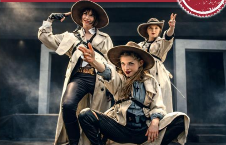
Die drei Musketiere nach Alexandre Dumas